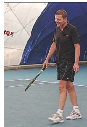
Momentka z turnaje