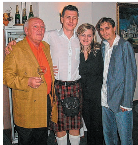
...a na večírek přišel i „Skot“

našimi autobusy. Všem řidičům osobní dopravy, kteří rozvoz zaměstnanců zajišťovali, proto patří poděkování.