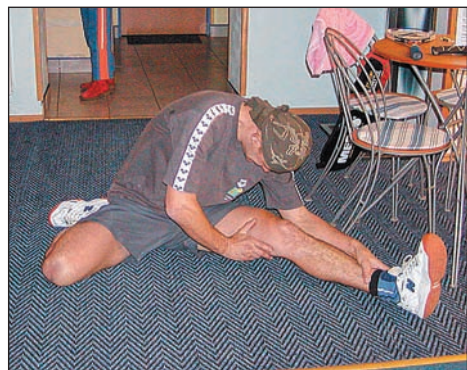
Důkladná příprava před utkáním.