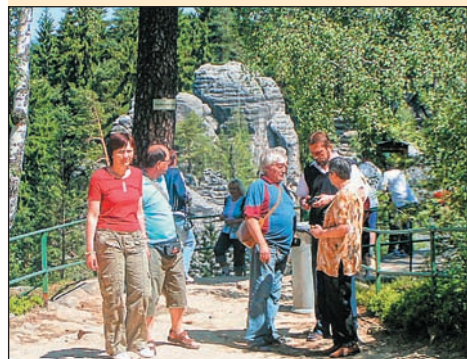
Momentka z minulé akce OSD

Na červenec tohoto roku je připraven čtyřdenní zájezd na Slovensko.