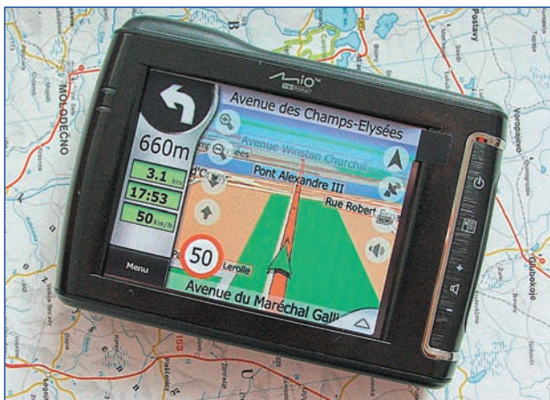
Navigační systém MioMap C710

Přístroj navádí řidiče pomocí české hlasové navigace a v případě sjetí z trasy přepočítává novou trasu. Navigační systém neustále sleduje pohyb vozidla a přizpůsobuje jízdou nenadálým situacím. Systém je schopen upozornit na uzavírky, dopravní zácpy nebo neprůjezdnost dané trasy,