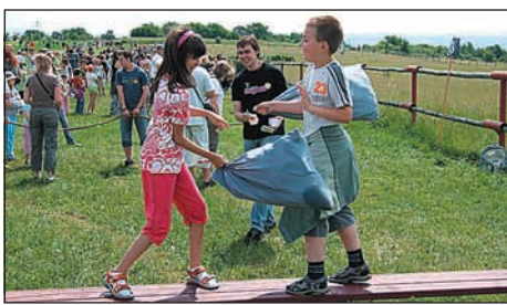
Děti se zde mohly vyřadit na různých atrakcích.

Letos byl naplánován výlet na farmu Bolka Polívky v Olšanech. Děti se zde mohly vyřadit na různých atrakcích. Od kolotočů přes skákací hrady, slézání obrovské Coca-Coly, až po jízdu na koních. Každý z capartů ať malých, nebo už těch školou povinných, mohl závodit v 30 disciplínách. Za účast v nich děti sbíraly „škrudlíky“, které mohly následně utratit buď na kolotočích, nebo si za ně koupit něco ve speciálním obchůdku. A děti se opravdu činily, svou zručnost a odvahu si všechny pošťavně procvičily. Koncert Anety Langerové, nebo skupina vojáků z dob napoleonských válek byly velkým lákadlem jak pro malé, tak pro velké.