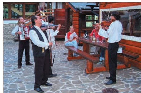
K slavnostní večeri v kolibě nám zahrála cikánská kapela.

Pan majitel pro nás také uchytil soutěžní klání - zatloukání silného hřebíku do dřeva a řezání dřeva. Myslím si, že ani zástupkyně ženského pohlaví se nemusely za své výkony stydět. Tento večer jsme se náramně bavili. Následující den jsme podnikli výlet na polskou přehradu, kterou jsme napříč projeli výletní lodí. U přehrady se nacházel historický hrad. Prohlídka hradu v doprovodu