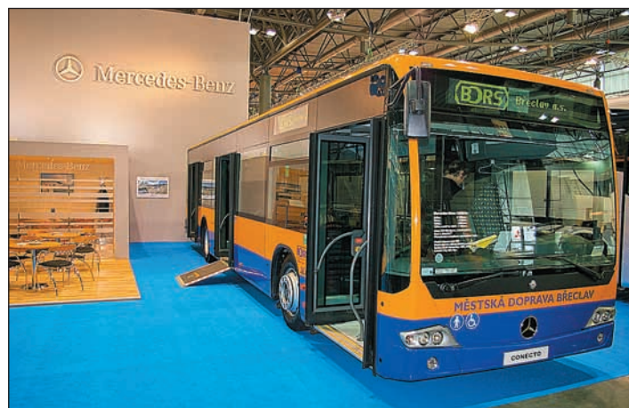
M-B typ CONECTO měli možnost návštěvníci výstavy zhlédnout u stánku firmy EvoBus Bohemia s.r.o.

Druhý náš autobus M-B Citaro, byl k vidění na volné ploše mezi pavilony v rámci doprovodného programu nazvaného Svět kamionů zblízka. Na tuto akci jsme byli přizváni pořadatelskou organizací, kterou byl Institut silniční dopravy Česmad Bohemia s.r.o. (ISD). Tato společnost vznikla začátkem letošního roku v rámci aktivit sdružení Česmad Bohemia a jejím úkolem je nábor a příprava nových profesionálních řidičů a řidiček, kterých je na trhu akutní nedostatek. V rámci této expozice společnost ISD prezentovala