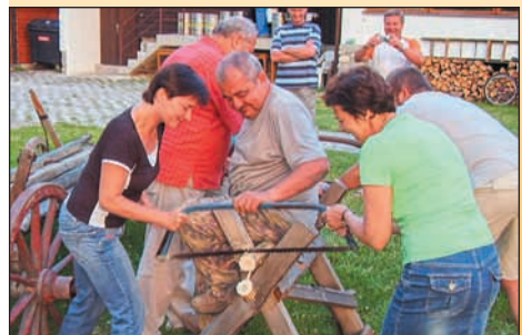
Myslím si, že ani zástupkyně ženského pohlaví se nemusely za své výkony stydět.

Náš výlet do Pienin (slovensko-polské pomezí ve Vysokých Tatrách), začal deštivě. U firemního autobusu na dvoře jsme lehce promoklí uskrkávali kávu z plastových kelímků (podšálky jsme našťastí neměli) a nadcházející dny jsme viděli trochu pesimisticky. Ale již v autobusu začala panovat a také „kolovat“ dobrá nálada. Cestou nám sice přišlo, ale s rostoucí vzdáleností od pracovních povinností a zlobících dětí naše těšení rostlo. Do útulného domácího penzionu s názvem Pltník v Červeném Kláštore jsme přijeli kolem jede-