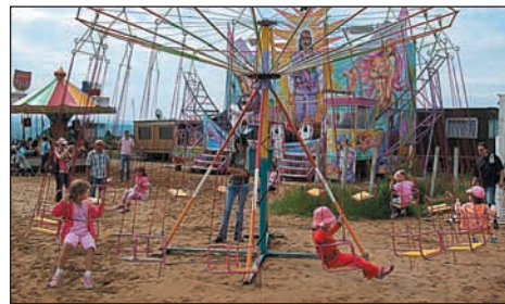
Momentka z MDD