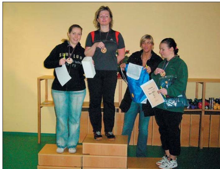
Účastnice turnaje z řad něžného pohlaví.

Zaměstnanci naší firmy mají celoročně možnost si zdarma, po předchozí telefonické rezervaci kurtu a předložení karty zaměstnance, zahrát squash ve Squash centru v Břeclavi - Poštorné . K dispozici zde jsou dva squashové kurty s klimatizací a vzduchotechnikou, což uvítají hlavně ti, kteří se ani přes léto nechtějí vzdát této skvělé sportovní hry. Samozřejmostí je také bar, kde se hráči mohou občerstvit, protože pravidelný přísun tekutin je při squashu nutností. V tomto příjemném prostředí se 28. prosince loňského roku konal již sedmý ročník vánočního „borsáckého“ squashového turnaje . V poslední neděli roku 2008 se zde v 9 hodin sešli ti, kteří chtěli protáhnout svá těla a poměřit síly s kolegy. Nevyzpytatelný černý míček prověřil fyziku všech hráčů a propocená trička byla jen důkazem