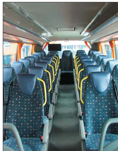
K vyššímu pohodlí cestujících přispívá také ergonomické tvarování sedaček.

Důležitým faktorem je pohodlí cestujících, k jejich maximální spokojenosti přispívá také ergonomické tvarování sedaček. Velká okna zajišťují dostatečné prosvětlení prostoru pro