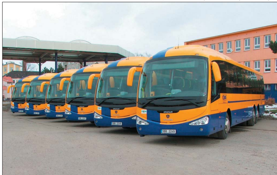
Autobusy řady Scania Irizar patří k nejmodernějším vozidlům ve vozovém parku divize osobní dopravy.