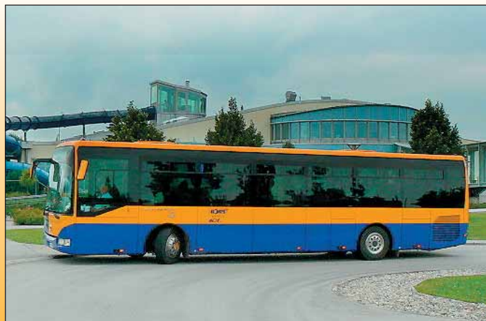
Autobus Iveco Irisbus Crossway LE před termálními lázněmi v Laa an der Thaya.