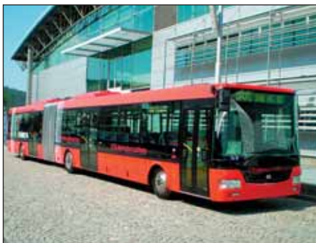
Kloubový autobus s hybridním pohonem NBH18 od společnosti SOR Libchavy s.r.o.

i několik ekologických modelů, ať už s hybridním, nebo s plně elektrickým pohonem. Společnost Iveco přivezla mimo jiné bezemisní nákladní vůz Daily Electric, Avia představila nový model Smith Newton, první nákladní vůz v kategorii 6 až 12 tun na elektrický pohon. Tatra zde měla premiéru modelu 810 v civilní verzi. Z autobusů zaujaly novinky společnosti Iveco Irisbus – třínápravový autokar Magelys HDH s prosklenými střešními panely a nový nízkopodlažní autobus Citelis s CNG pohonem. Výrobce autobusů SOR Libchavy se pochlubil dvěma prototypy - městským elektrobusem EBN 10,5 a kloubovým autobusem s hybridním pohonem NBH18. Společnost Solaris Bus & Coach představila nízkopodlažní autobus Solaris 12 Urbino s paralelním dieselelektrickým pohonem.