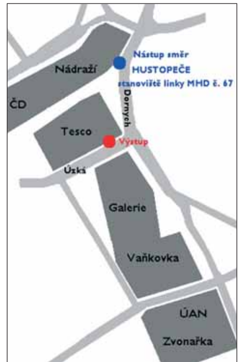
Mapka nástupu a výstupu v Brně.

Cestující zavedení nové linky přivítali s povděkem a postupně jich přibývá. V těchto prvních měsících je však nevýhodou naší linky, že cestující již mají zakoupeny levnější předplatní jízdenky IDS JMK, které mají navíc v ceně započítáno i cestování po Brně. Na počet cestujících má také vliv skutečnost, že nám nebyla schválena verze jízdního řádu přes Velké Němčice, Nosislav, Modřice