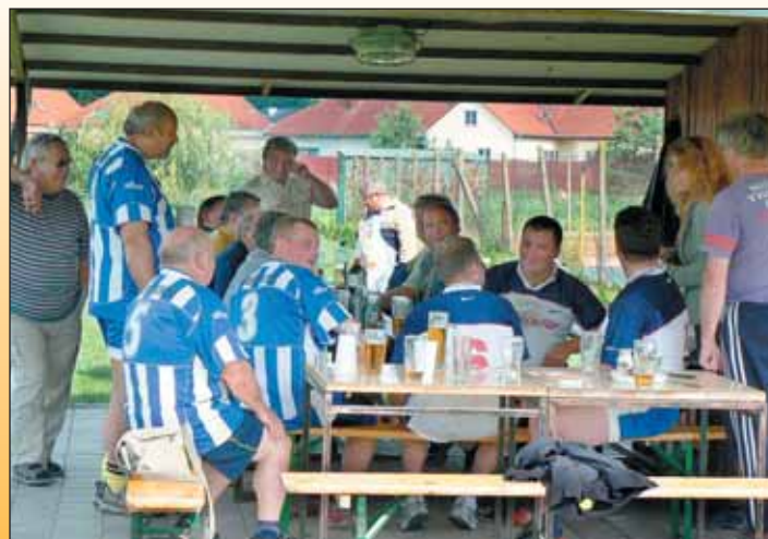
Zábava probíhala na hřišti i mimo něj.