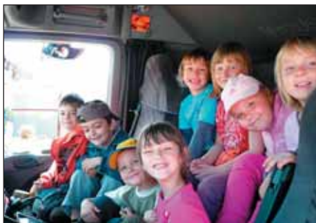
Děti zkusily, kolik se jich do kabiny nákladního auta vejde.

Po vydovádění v autobuse a kolem něj následovala prohlídka nákladního automobilu Merce-