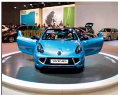
Nový kabriolet Renault Wind.

Hned po vstupu do prvního pavilonu bylo jasné, v jakém duchu letošní výstava bude a kudy se ubírá vývoj osobních i nákladních vozidel. Každý z přítomných vystavovatelů totiž měl v nabídce