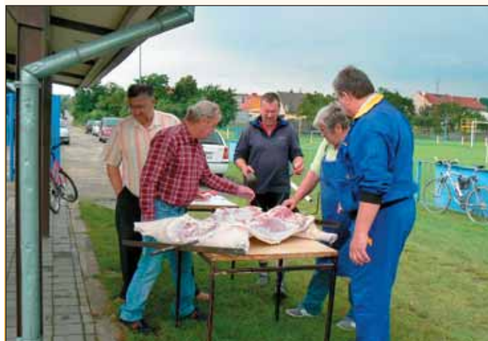
Příprava „čuníka“ před opékáním.