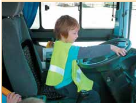
Všechny děti si mohly „zatroubit“ a vyzkoušet jaký má řidič autobusu výhled.