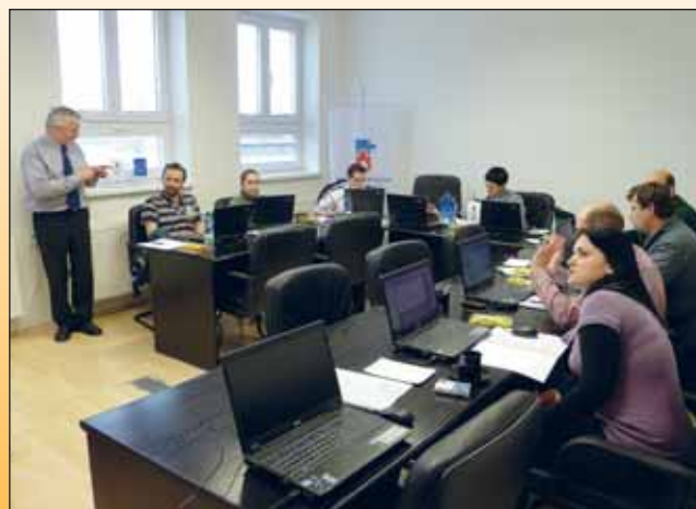
Školení dovedností v programu MS Office Excel - Makra.