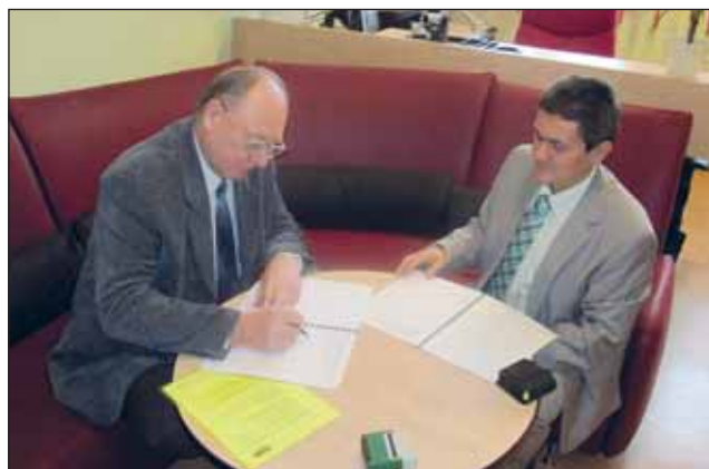
Podpis nové kolektivní smlouvy.

Navzdory hospodářské, finanční a ekonomické krizi, tendenci všech soukromých i státních podniků a institucí šetřit, se u nás obě strany nejenže dohodly na zachování všech stávajících výhod (zkrácená pracovní doba, dodatková dovolená, odměny při významných životních jubileích, penzijní připojištění, jízdní výhody a mnoho dalších), ale i na jejich rozšíře-