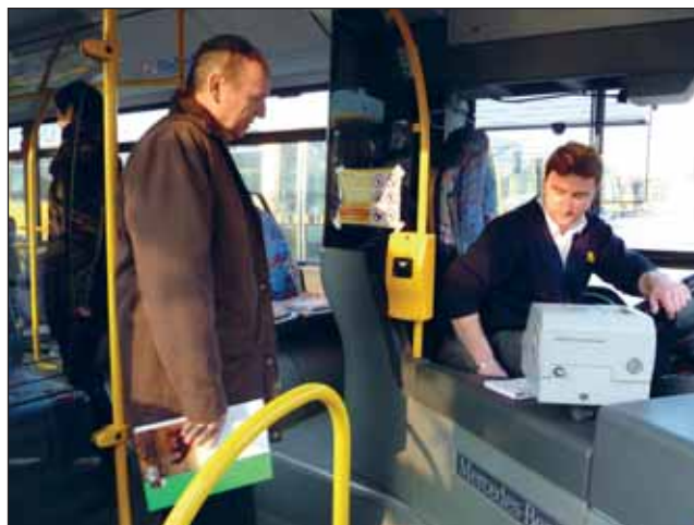
Momentka ze samotného auditu městské linky.