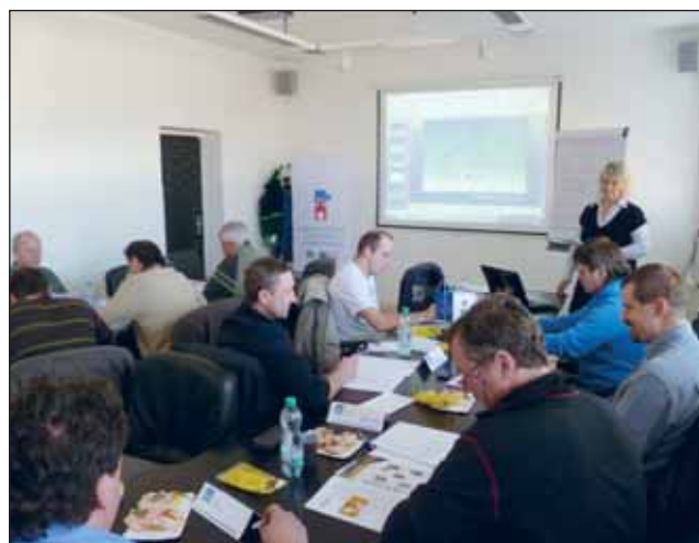
Školení práce pod tlakem - řidiči OD.

Pro další zvýšení efektivity výuky mají možnost účastníci kurzů využít virtuální třídu, která slouží jako moderní nástroj ke komunikaci lektora s účastníky. V rámci virtuální třídy mají účastníci některých kurzů možnost ověřit si své znalosti po absolvování kurzu v krátkých e-learningových testech. V nejbližší době budou zpřístupněny