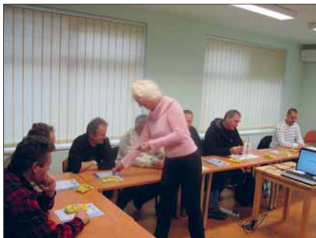
První školení asertivního jednání - řidiči ND.

Jako vítězný uchazeč byla vybrána společnost TEMPO TRAINING & CONSULTING a.s., která v oblasti školení působí již od roku 1996 a buduje si status renomovaného školicího střediska v oblasti vzdělávání dospělých. Portfolio poskytovaných služeb je natolik široké, že je společnost schopna zajistit realizaci vzdělávacích kurzů bez subdodavatelského subjektu. Za účelem zajištění kvality výuky povedou vzdělávací aktivity specializovaní lektori, kteří mají bohaté zkušenosti a dlouhodobou praxi v daném oboru.