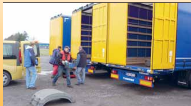
Převzetí zbylých nových návěsů v německém Werlte.