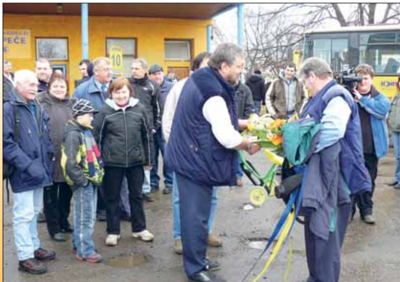
Gratulace účastníků rozlučky na autobusovém nádraží v Hustopečích.