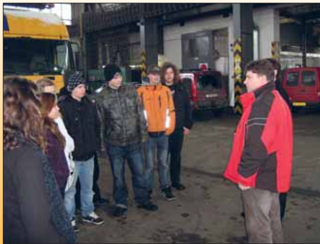
Návštěva opravárenství Břeclav.