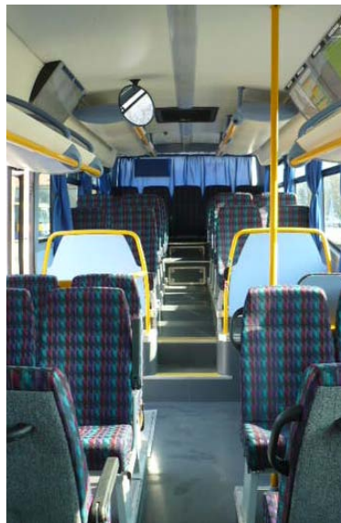
Interiér nových autobusů