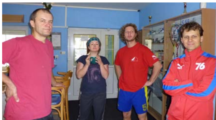
Soustředění před hrou