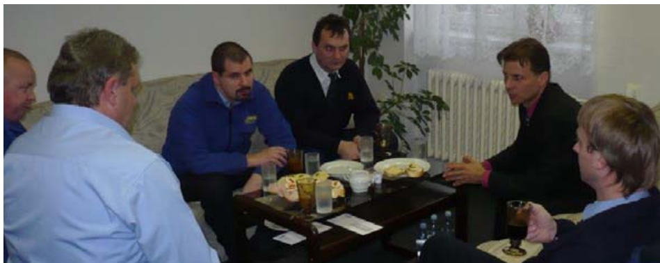
Diskuse s řidiči

Zavedení Motivačního programu souvisí s uzavřením „nových smluv“ v rámci IDS JMK. Konkrétně od spuštění linek IDS JMK na Brněnsku na jaře roku 2011 a pomalu se tak stává již standardní a samozřejmou součástí každodenní práce řidičů a dispečerů osobní dopravy.