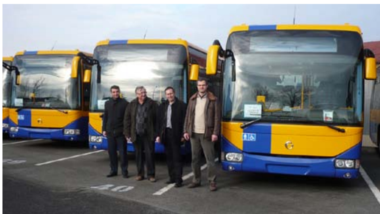
Přebírání nových vozů ve Vysokém Mýtě

Na přelomu roku 2013 a 2014 byly realizovány významné investice do vozového parku osobní dopravy, což svědčí o snaze poskytovat i nadále kvalitní služby s vysokým komfortem pro cestující.