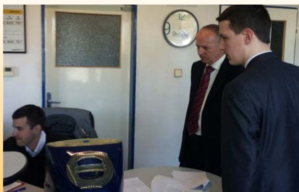
Externí audit na servisu Renault