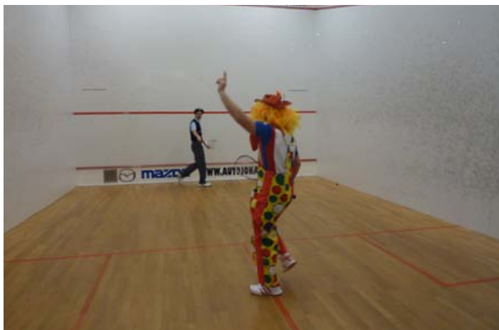
Hrálo se i v kostýmech...