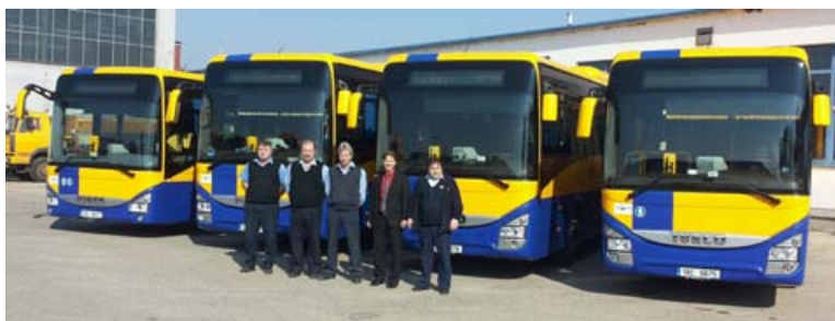
Nové autobusy v Břeclavi

vybaveny bezpečnostními pásy. Je zde také tažné zařízení pro případ požadavku na vozík pro zavazadla nebo kola. Motor je zde totožný jako u výše zmíněných vozů LE.