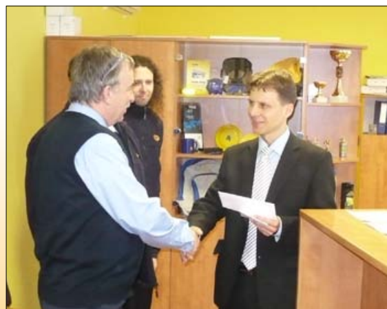
Vyhodnocení v Břeclavi