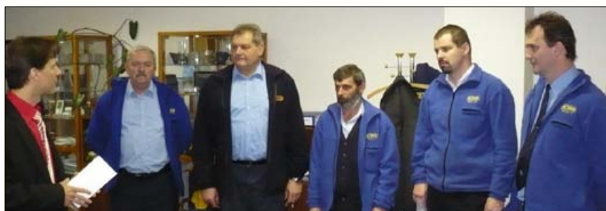
Vyhodnocení v Hustopečích