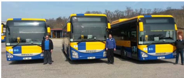
Nové autobusy v Hustopečích