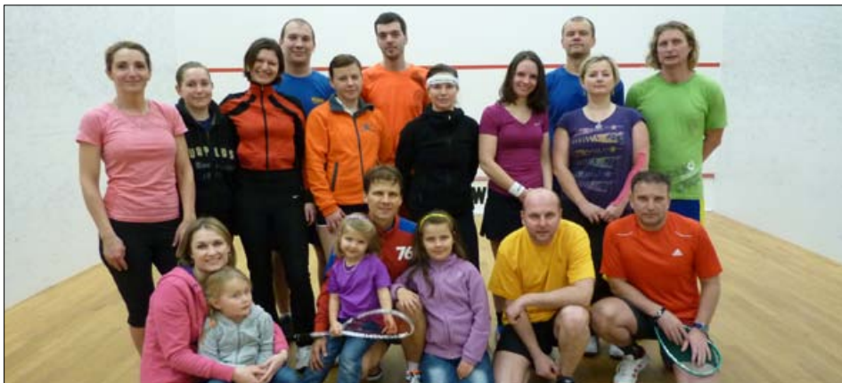
Všichni zúčastnění sportovci...