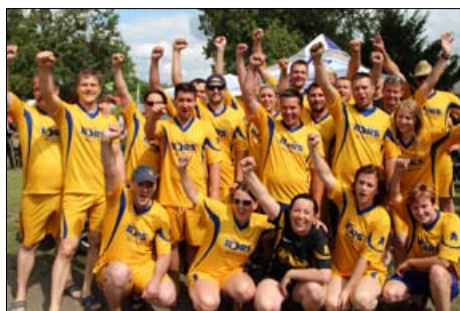
Tým The Best of BORS

druhé jízdě došlo ke kolizi, kdy do nás narazila posádka Remaxu, kvůli závadě na kormidle a přesměrovala nás na další loď. Při prudkém nárazu z lodi vypadla našťastí jen bubenice, kterou poté vytáhli a odvezli na břeh záchranáři