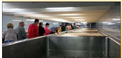
Prohlídka pivovaru v Litovli

Jako každý rok jsme i letos na konci června vyrazili na pravidelný 3 denní zájezd pořádaný OSD. Letos jsme zavítali na Severní Moravu.