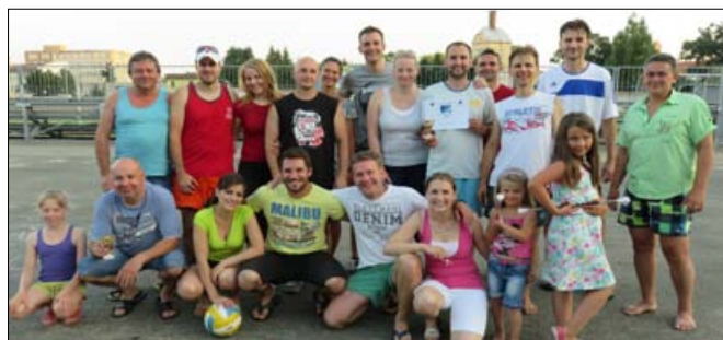
Hráči a fanoušci

Bohužel ani při zápasech se nám nevyhnulo zranění či únava z přehřátí, jelikož parno bylo opravdu velké. Ale bylo vidět, že každý tým dával do toho vše a že se sem všichni přišli nejen pobavit,