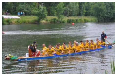
Tým na vodě...

druhé jízdě došlo ke kolizi, kdy do nás narazila posádka Remaxu, kvůli závadě na kormidle a přesměrovala nás na další loď. Při prudkém nárazu z lodi vypadla našťastí jen bubenice, kterou poté vytáhli a odvezli na břeh záchranáři