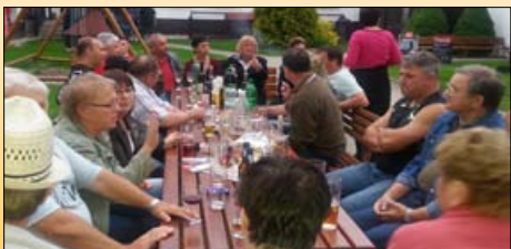
Společné večerní posezení

První den jsme na exkurzi ochutnali Litovelské pivo a poté se zchladili v podzemí Mladečské jeskyně. Den jsme ukončili večerní prohlídkou hradu Bouzov.