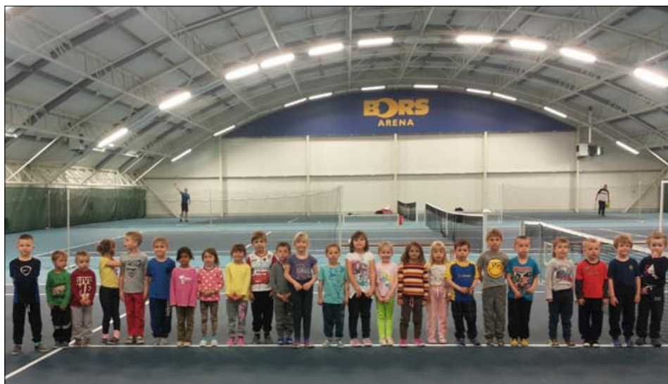
Děti z MŠ U Splavu v BORS Areně

I díky vám jsme dostaly úžasné ceny ve výtvorné soutěži vyhlášené naší MŠ „Čtyři království aneb základní podmínky života“. Jejím posláním bylo zachycení vztahu mezi přírodou a civilizací, kde jsme pracovaly s tématy: Slunce, vzduch, voda a půda. Jak se nám to povedlo,