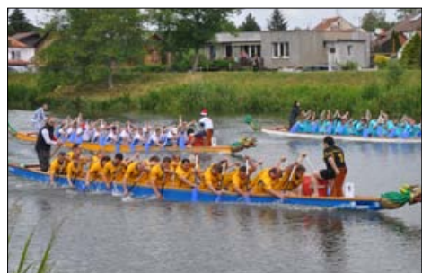
Jedeme do cíle...

Letos se závody Dračích lodí jely dne 20. 6. od 9 hodin. Počasí jsme se trochu všichni obávali, ale nakonec bylo příjemně. Konkurence byla opět velká, celkem závody čítaly 25 posádek nejen firem, partiček přátel, ale také profi teamů. Po prvním jízdě na 200 m jsme dojeli první mezi posádkou Remax a S-ko team a při