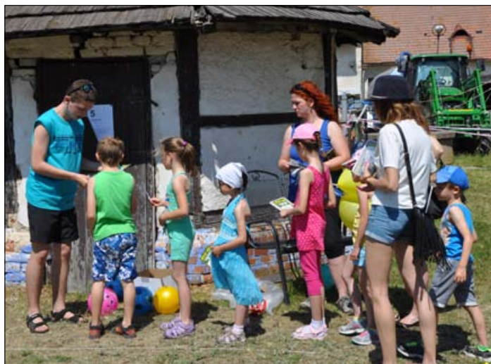
Děti při hře