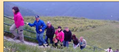
Výšlap na horní vodní nádrž Nové Stráně