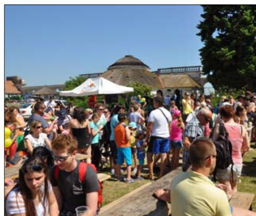
Dětský den na Novém dvoře

Za absolvování všech herních staniček si odnesly různé ceny. Po ukončení akce byly předány granty z Nadačního fondu Luděk pro lidi a proběhla aukce dresu Jaromíra Jágra a Jakuba Voráčka. Výtěžek z aukce bude věnován dětem z břevclavska na léčebné pobyty v Klimkovicích.