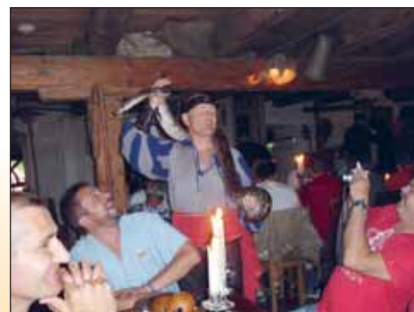
V krčmě v Dětenicích.

Neděle zvolna plyne a my na zpáteční cestě ještě zavítáme na zámek Hrádek u Nechanic. Málokdo z nás tušil, že máme