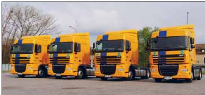
Nová vozidla DAF XF105.

MEGA LINER SDP 27, které byly uvedeny do provozu v únoru letošního roku. Dalšího rozšíření se divize dočkala v dubnu