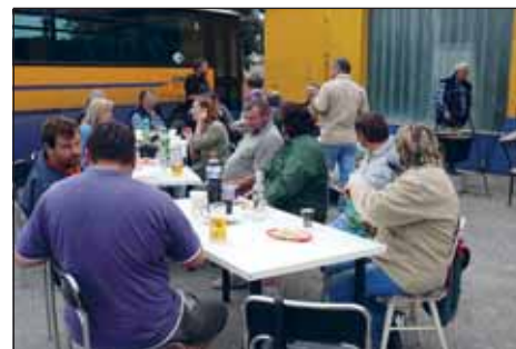
Momentka z akce.

Správná nálada vydržela až do pozdních večerních hodin, jak je možno z doložené fotodokumentace vidět. Na akci se sešlo cca 40 spokojených zaměstnanců a hostů.