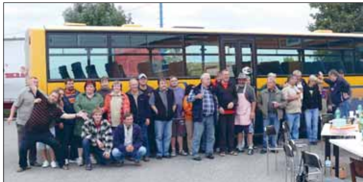
Společné foto zúčastněných.

Všem účastníkům se setkání líbilo, a proto si pohráváme s myšlenkou i v příštím roce něco podobného opět zopakovat.