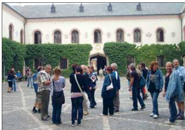
Na nádvoří zámku Sychrov.

Jistě si někteří vzpomínáte, že před pár lety jsem začínala své vyprávění úryvkem z písně: Koukám, jak ten čas letí... Několik let uběhlo a já mám zase tu čest podělit se s Vámi o několik vzpomínek z dalšího podnikového zájezdu. Tentokrát jsme vytvořili mix – trochu poznávání, špetku turistiky.