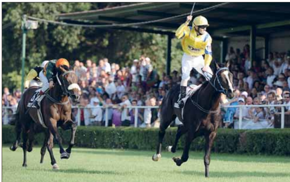
Rocky of Gracie ve vítězném Slovenském derby.

vyšetření nutná k vykonávání profese řidiče už budou zahrnovat pouze vyšetření dopravním psychologem. Povinné vyšetření neurologem, včetně vyšetření pomocí EEG, se naopak zcela zrušuje. Výrazně se rovněž zužuje okruh osob, které budou oprávněny provádět dopravně psychologická vyšetření. Tyto osoby budou muset nově mít akreditaci udělenou Ministerstvem dopravy, která je podmíněna mj. postgraduálním vzděláním v oboru dopravní psychologie.