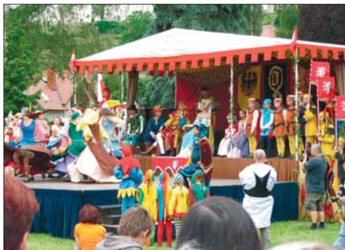
Veselí v dobových kostýmech.