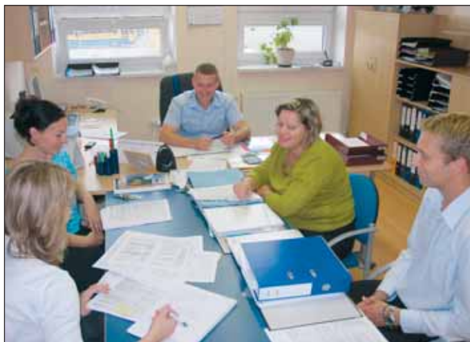
Interní audit na divizi nákladní dopravy.

Vzhledem k tomu, že audity skončily před pár dny, bude závěrečná zpráva manažerem kvality teprve zpracována. Prozatímni výsledky však ukazují, že nebyly zjištěny žádné závažné nedostatky, ale spíše drobná zjištění, podněty pro zlepšení či doporučení, která se ve většině případů budou řešit aktualizací stávající interní dokumentace. Termíny pro splnění úkolů, které z auditů vyplynou, budou stanoveny tak, aby se společnost připravila