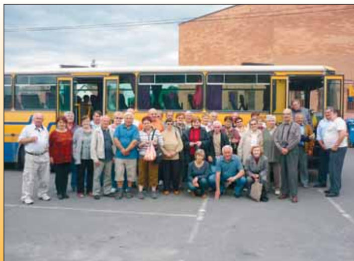
Společné foto účastníků zájezdu.