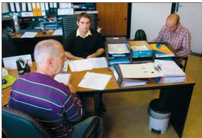
Interní audit u technika BOZP, PO a ekologie.