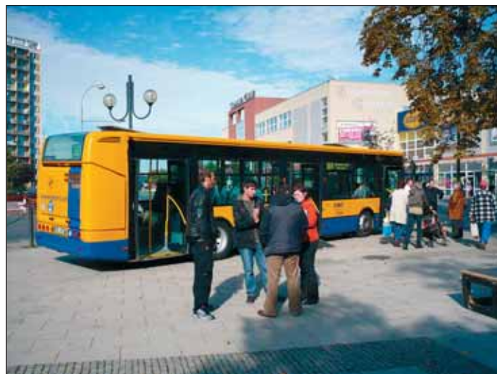
Návštěvníci akce před nízkopodlažním autobusem značky Irisbus Citelis.