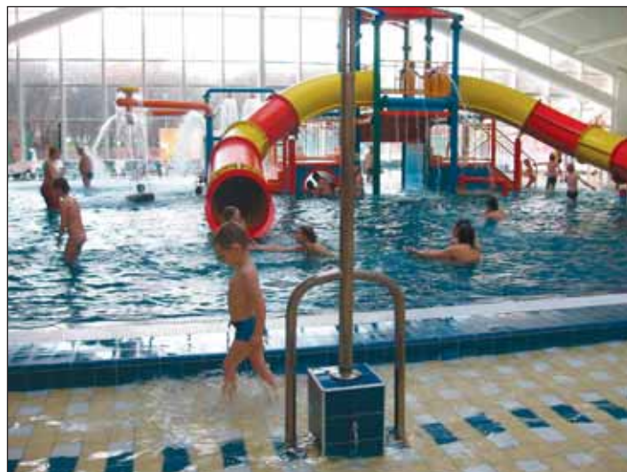
Bazén s dětskými atrakcemi.