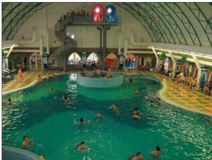
Pohled na krytý bazén.