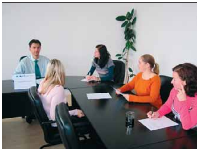
Seznámení s projektem.